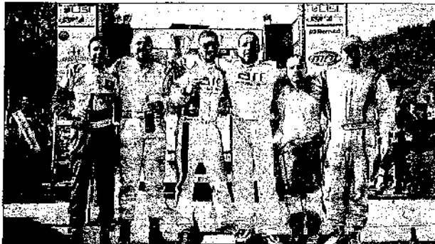
Il podio dello scorso anno

Numerosi saranno gli eventi a corollario della gara vera e propria, nel periodo che precederà il weekend del 7 ed 8 settembre. E' infatti necessario non limitarsi ad accogliere equipaggi e pubblico nei due giorni della corsa. Un evento di questa rilevanza e con un nome così glorioso deve riuscire a creare un incoming turistico, fra i vari enti e soggetti che sostengono l'iniziativa, che vada oltre il semplice "assistere" alla corsa e che vada a protrarsi per svariati giorni. Eventi, incontri, ed iniziative varie serviranno proprio a strutturare questa rete del turismo e dell'accoglienza che si spera di potenziare e portare al regime massimo già dalla prossima edizione.